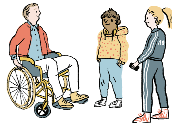
ludzie, którzy mają rozwidzionych rodziców