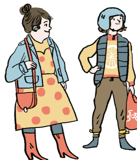
osoby, które mają trójkę rodzeństwa